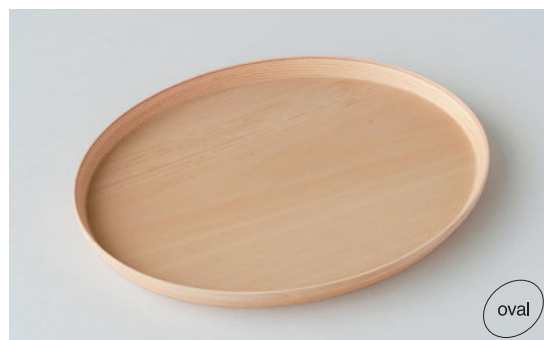
NEW TRAY #2327N ナチュラル ¥9,000 サイズ：370×300×H25mm (税込 ¥9,900)