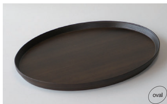
TRAY #614 ダークブラウン ¥9,000 サイズ：370×300×H25mm (税込 ¥9,900)