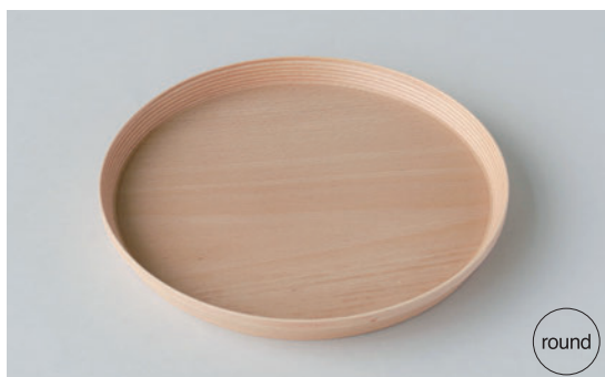
NEW TRAY #2322N ナチュラル ¥6,000 サイズ：φ270×H25mm (税込 ¥6,600)