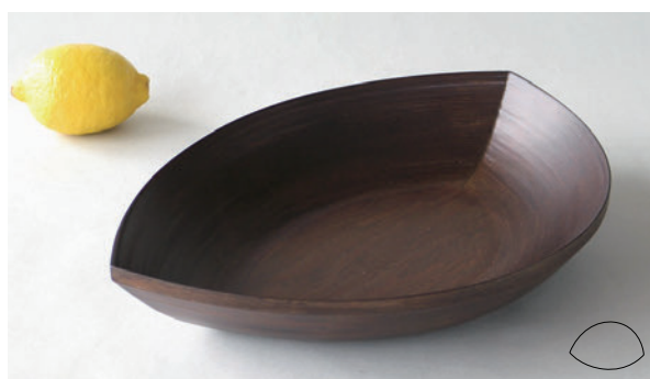
PLATE #836 ダークブラウン