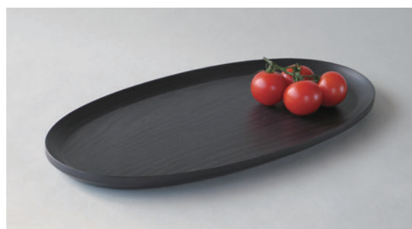
(受注生産) TRAY #127 ブラック ¥12,000 サイズ：435×220×H25mm (税込 ¥13,200)