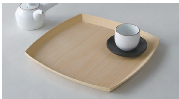
(受注生産) TRAY #219 ナチュラル ¥20,000 サイズ：335×335×H28mm (税込 ¥22,000)