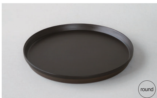
TRAY #619 ダークブラウン ¥6,000 サイズ：φ270×H25mm (税込 ¥6,600)